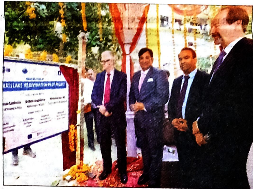
Kimmo Lahdevirta, Finland's Ambassador to India, inaugurates the pilot water purification project in Gurugram on Monday.

Kimmo Lahdevirta, Finland's Ambassador to India,