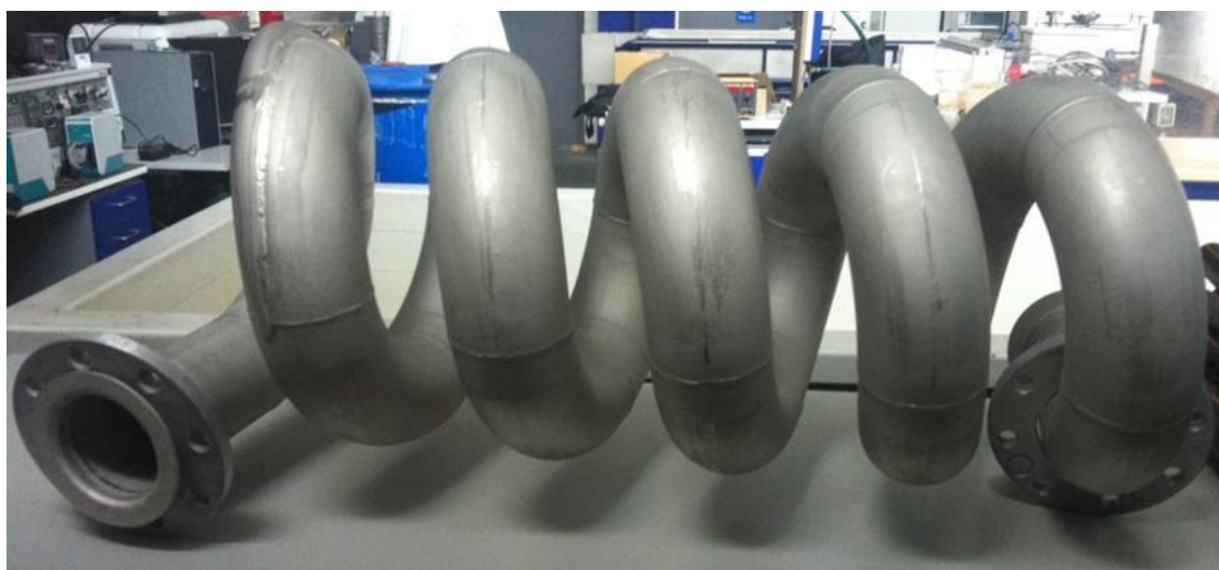
Kuva 2: SaoxFugen prototyyppi

SansOx Oy on vuonna 2012 perustettu suomalainen cleantech-alan yhtiö, joka tutkii ja kehittää kestäviä vedenpuhdistusmenetelmiä vesihuollon, teollisuuden, maatalouden ja kalatalouden tarpeisiin, kaivosteollisuudelle ja vesistöjen parantamiseen. SansOx:n päätuote on SansOx OxTube, jonka käytännön sovelluksiin yhtiö etsii yhteistyökumppaneita.